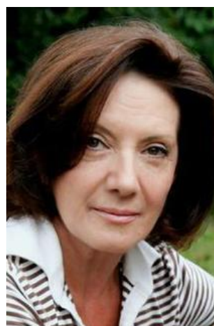
Marie Rottrová, 77 let, zpěvačka.