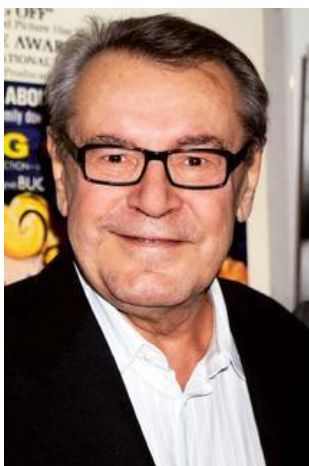
Miloš Forman 1932-2018. Filmový režisér a herec, držitel dvou Oskarů a mnoha dalších ocenění v oblasti filmové tvorby.

Nejprodávanější spisovatelka na světě. Napsala celkem 70 románů a 32 souborů povídek, kterých se prodalo více než dvě miliardy.