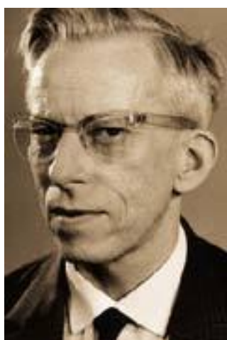
Otto Wichterle, vynálezce, chemik, akademik, 1913 - 1998, vynálezce měkkých kontaktních čoček.