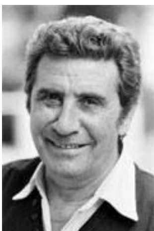
Gilbert Bécaud, zpěvák, 1927 – 2001