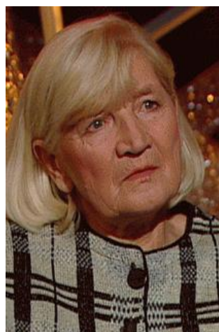
Eva Kantůrková, 89 let, scénáristka, spisovatelka.