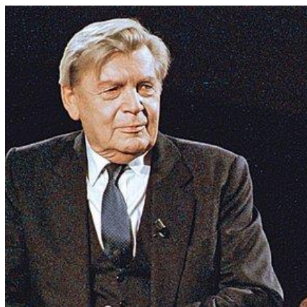
Jiří Hanzelka, český cestovatel, spisovatel a publicista, 1920 – 2003