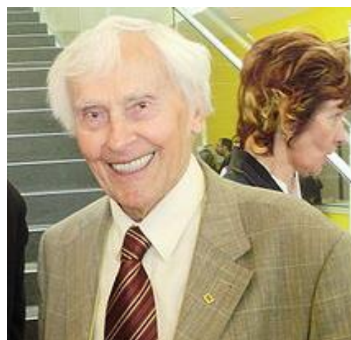
Miroslav Zikmund, 100 let, český cestovatel a spisovatel.