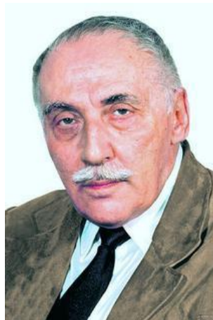
Miloš Kopecký, herec, 1922 - 1996