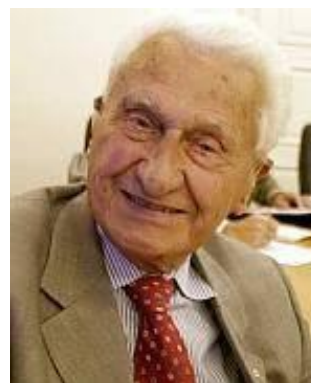
Tomáš Baťa mladší, 1914 – 2008, česko-kanadský podnikatel, syn Tomáše Bati. Po roce 1989 se věnoval povznesení podnikatelské vzdělanosti a kultury v ČR a na Slovensku. Byl držitelem nejvyššího kanadského vyznamenání Řádu Kanady nejvyššího stupně a stal se nositelem Řádu T. G. Masaryka II. třídy.