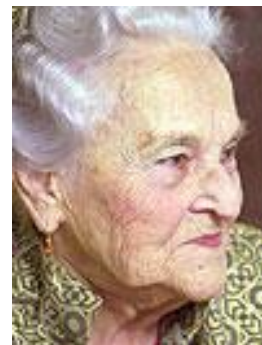
Zita Kabátová, 1913 – 2012, hrála ve více než 50 filmech, poprvé v roce 1936. V posledních letech hrála např. ve filmech Želary, Zapomenuté světlo nebo Babí léto. Do konce svého života byla velmi činorodá, optimistická a ráda vzpomínala na svoji práci.