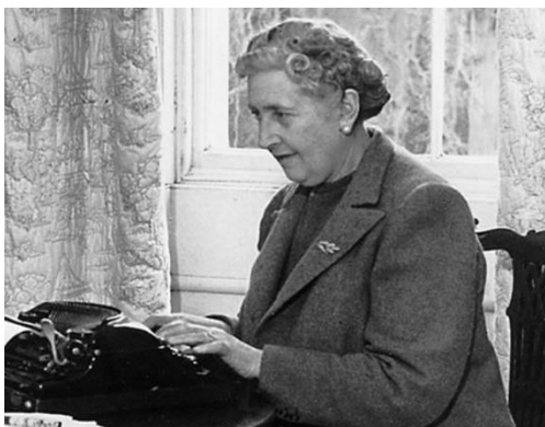
Agatha Christie, 1890 – 1976.

Nejprodávanější spisovatelka na světě. Napsala celkem 70 románů a 32 souborů povídek, kterých se prodalo více než dvě miliardy.