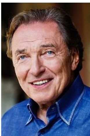
Karel Gott, 80 let, zpěvák, herec, malíř.